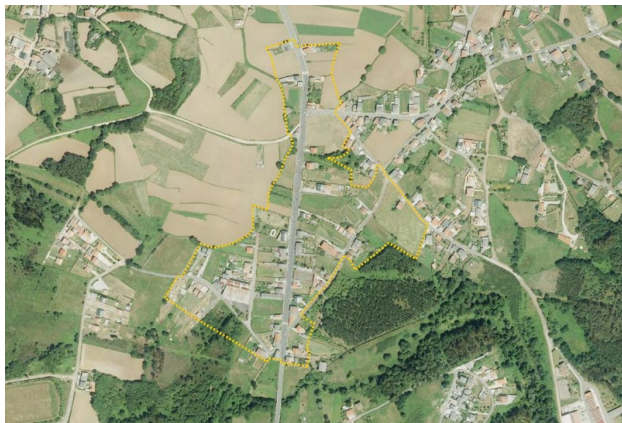
Ámbito da delimitación de núcleo rural

Ámbito de actuación: núcleo rural da Ponte Rosende, situado ao sur da Vila de Carballo, na parroquia de San Xoán de Carballo.